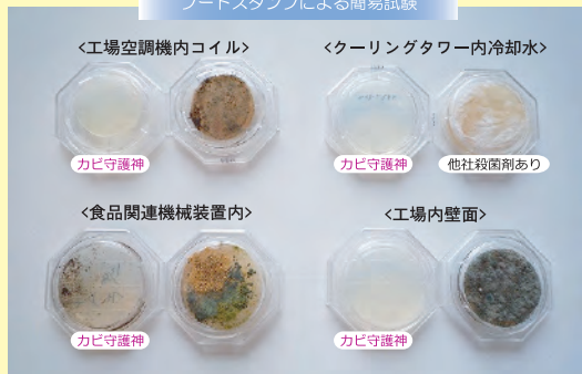
フードスタンプによる簡易試験

食品工場の各箇所にてカビ菌を採取し、左側にはカビ守護神を噴霧してカビ繁殖の経過比較試験を行いました。