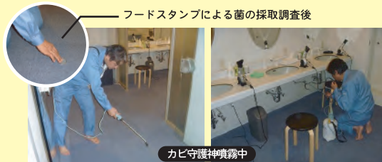
フードスタンプによる菌の採取調査後

エアコンや車内、トイレの臭いなど、生活内で発生する様々な悪臭はカビが原因である事が多くあります。健康にも害を及ぼすカビの繁殖・胞子の飛散を防ぎ、環境改善に役立ちます。