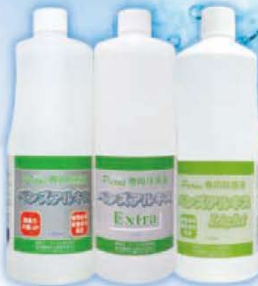
左:ベンズアルキス 中:ベンズアルキスExtra 右:ベンズアルキスLight